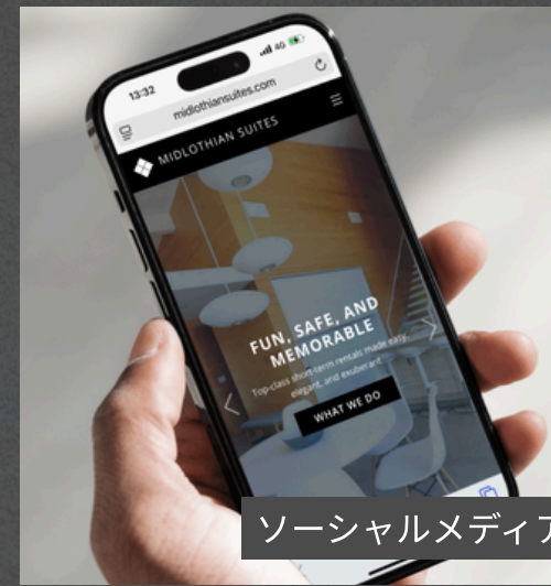
ソーシャルメディアブランディング、ナラティブ作成、ウェブ開発