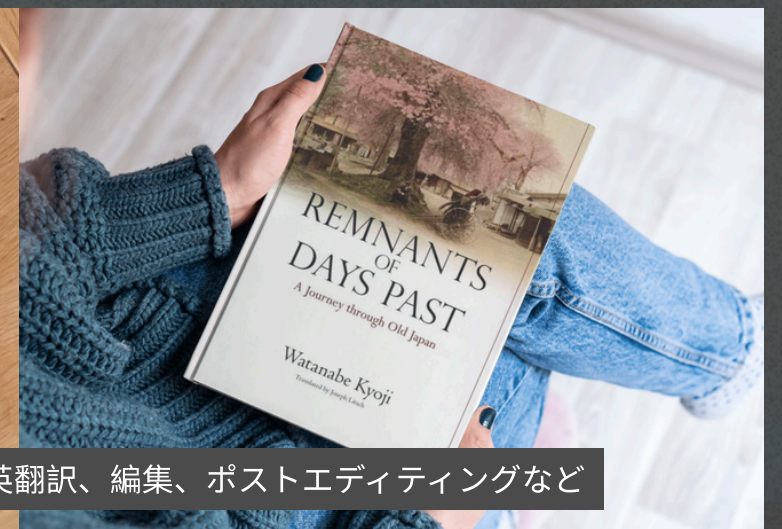
日英翻訳、編集、ポストエディティングなど