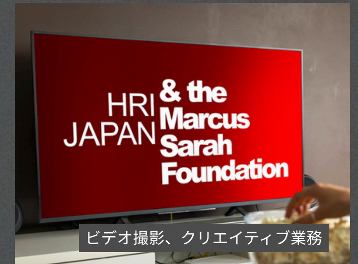
ビデオ撮影、クリエイティブ業務